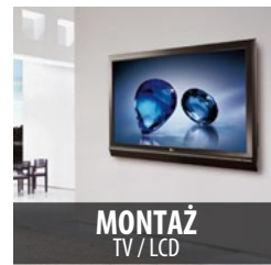
MONTAŻ TV / LCD