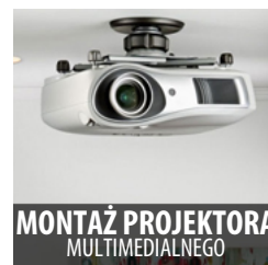
MONTAŻ PROJEKTORA MULTIMEDIALNEGO