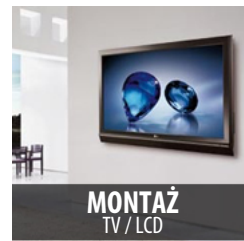
MONTAŻ TV / LCD