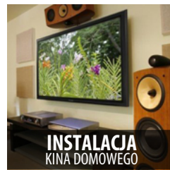
INSTALACJA KINA DOMOWEGO